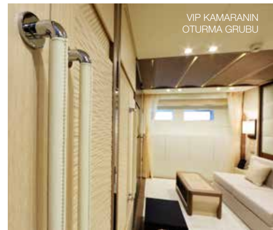
VIP KAMARANIN OTURMA GRUBU