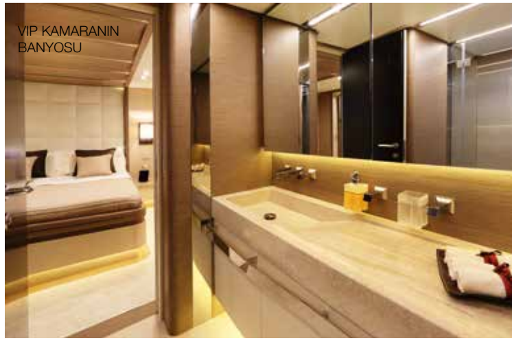
VIP KAMARANIN BANYOSU